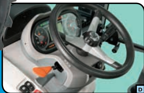
TABLEAU DE BORD ET VOLANT REGLABLE

Le tableau de bord élégant et bien éclairé s'incline avec le volant permettant au conducteur de surveiller constamment les fonctions et la performance du tracteur. L'inclinaison est réglée par le biais d'une pédale commodément placée au-dessous du tableau. Placée à portée de la main sur le tableau de bord se trouve également la commande d'inverseur. (fig. D).